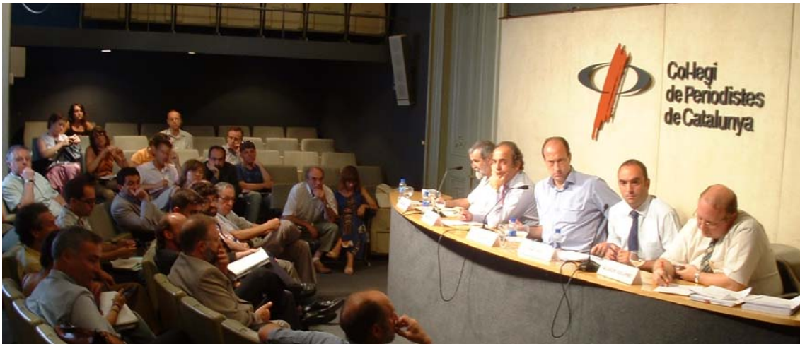
Acte de les VI Jornades d'Informació Ambiental sobre el "Pla de l'Energia a Catalunya".

Organitzades pel Grup d'Informació Ambiental (GIA) de l'Associació Catalana de Comunicació Científica (ACCC), les jornades se celebren anualment des de l'any 2000 amb la finalitat de presentar una visió àmplia que reculli tots els punts de vista respecte un tema d'actualitat o de futura actualitat d'informació ambiental. Les jornades s'adrecen als professionals de la comunicació del sector i consisteixen en una taula rodona, de dues hores, amb experts de diferents àmbits, que fan intervencions d'entre 15 i 20 minuts cadascun, i una fila 0 amb altres representants implicats i interessats en el tema, que també participen en el debat. Posteriorment hi ha un dinar amb els periodistes per poder aprofundir en alguns temes específics.