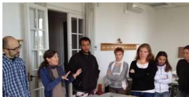
Alguns dels assistents al curs