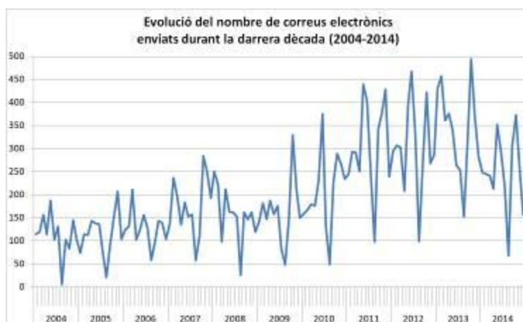
Imatge 5. Missatges enviats el 2014 i evolució durant els últims 10 anys.