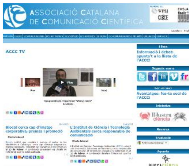
Imatge 4. Vista de la portada del web http://www.accc.cat