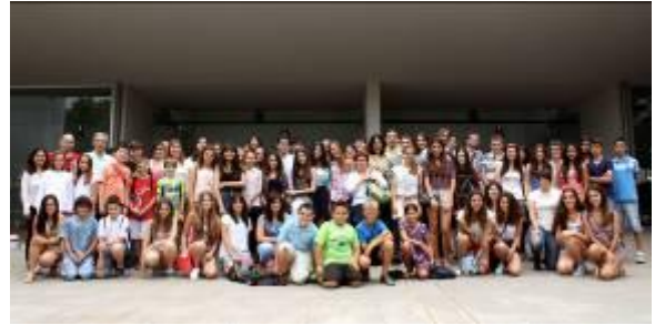
Els guanyadors de l'edició de 2014