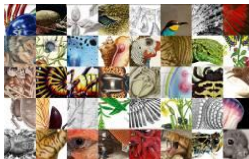
Collage amb les obres finalistes

Il·lustraciència va portar al novembre les obres guardonades de la seva segona edició al Centre Cultural Sant Josep de L'Hospitalet de Llobregat en una exposició que va incloure una mostra de 40 reproduccions de les obres finalistes del concurs.