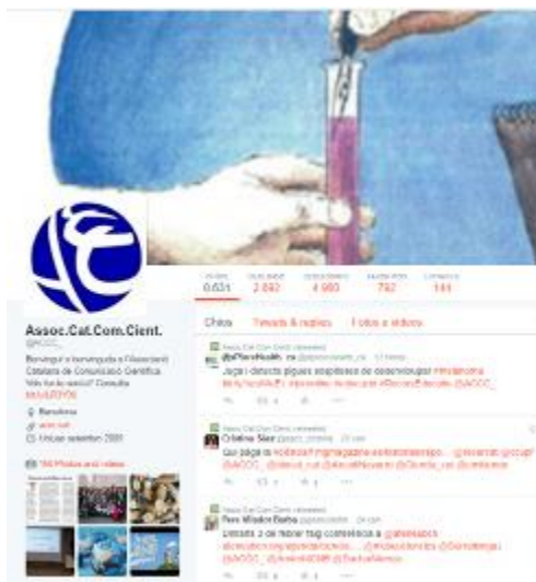
Imatge 6. Perfil de l'ACCC a Twitter.

L'aposta per aquestes eines és un pas cap a la consolidació de l'Associació en la comunicació 2.0.