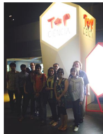
El grup de l'ACCC que va assistir a la visita

Top ciència . A aquest nom respon l'espai que el museu Cosmocaixa de Barcelona va destinar el 2014 a actualitat científica. Amb motiu de la seva estrena, un grup de sòcies i socis de l'ACCC -que acostumen a reunir-se al voltant del grup d'emprenedoria de l'associació- es va acostar l'11 de juny a conèixer els secrets d'aquesta iniciativa. Top ciència es va compondre d'instal·lacions interactives que -a través d'infografies, vídeos, jocs i tests- per empènyer el visitant a descobrir els detalls de les investigacions seleccionades i avaluar què aporten a la societat. Al moment de la inauguració era protagonista el treball sobre la sida dut a terme per l'Institut de Recerca de la Sida (IrsiCaixa), així com estudis sobre quàntica relacionats amb seguretat informàtica que desenvolupa l'Institut de Ciències Fotòniques (ICFO).