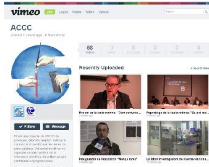
Imatge 7. El perfil de l'ACCC a Vimeo

Durant el 2014, l'ACCC va continuar impulsant el seu material audiovisual elaborant cròniques i reportatges dels seus esdeveniments i entrevistes a experts que han participat en les activitats de l'associació. L'entitat disposa, a data 26 de gener de 2015, de 68 vídeos propis a la seva biblioteca audiovisual del seu perfil de Vimeo: http://vimeo.com/accc