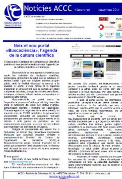
Imatge 1. Exemple de butlletí (número 90)

El butlletí es pot consultar a l'enllaç: http://www.accc.cat/index/pg.40.517.html