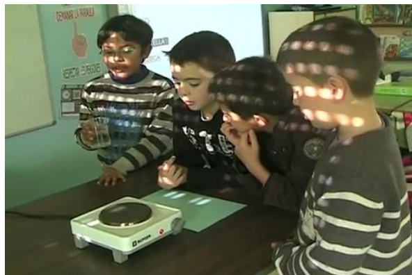
«Plou», de l'Escola La Noguera (Balaguer), va guanyar el premi X(p)rimenta de primària la passada edició

Busquem alumnes i professors que vulguin fer experiments interessants i que els gravin en vídeo. Aquest és l'objectiu del concurs X(p)rimenta que fa un mes va engagar la segona edició. El certamen, promogut per l'Associació Catalana de Comunicació Científica (ACCC) i la Fundació Institució Catalana de Suport a la Recerca, premiarà les millors obres audiovisuals i les incorporarà al portal Recerca en acció .