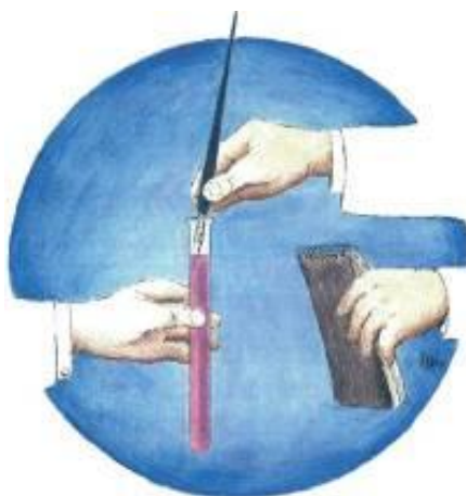
Dibuix que Fernando Krahn va fer expressament a l'ACCC el 1990