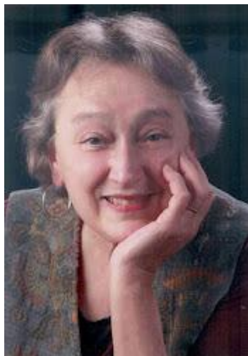
La biòloga Lynn Margulis (1938-2011)

A l'acte, que tindrà lloc a la sala Prat de la Riba de l'entitat situada al carrer del Carme 47, es presentaran fragments de la personalitat d'una dona que ha deixat empremta en la comprensió de l'evolució de la vida i de la terra, i es revelaran diversos aspectes de la seva vida personal. L'acte, que tindrà lloc de 18.00 a 21.00, es podrà seguir en directe per Internet.