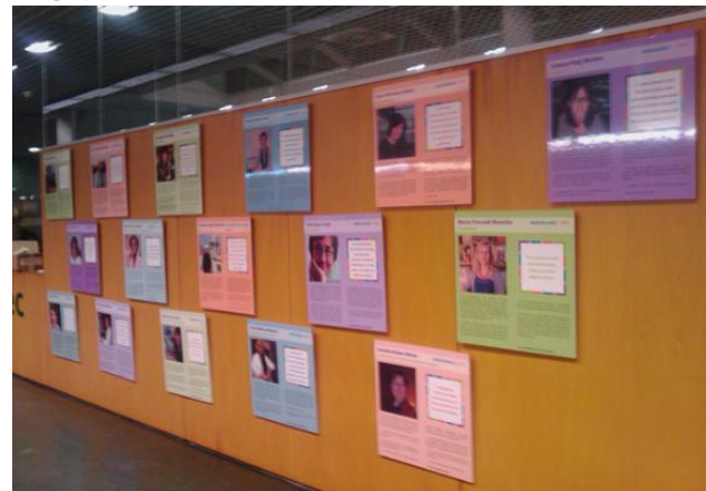
Muntatge de l'exposició a la UdG

Més informació: http://16cientifiquescatalanes.blogspot.com/ .