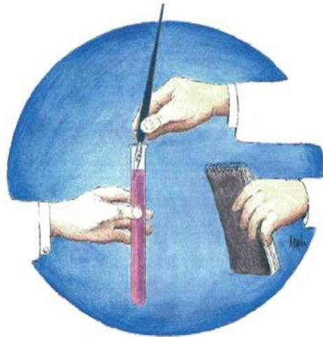
Dibuix que l'il·lustrador Fernando Krahn va fer expressament a l'ACCC el 1990, ara publicat al nostre web.