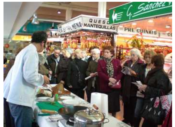
La jornada de «Ciència en el mercat» que va organitzar l'ACCC en el mercat de Les Corts, amb motiu de la Setmana de la Ciència el 18 de novembre, va ser un èxit.