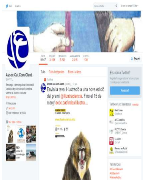
Perfil de l'ACCC a Twitter.

L'aposta per aquestes eines és un pas cap a la consolidació de l'Associació en la comunicació 2.0.