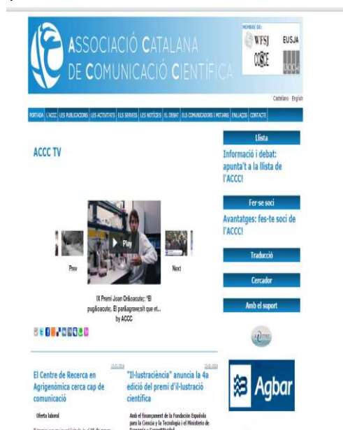
Vista de la portada del web http://www.accc.cat/