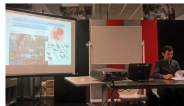
Inauguració de l'exposició individual de Roc Olivé Pous a la Biblioteca Sagrada Família

És la segona edició d'un cicle d'activitats d'il·lustració científica organitzat per Il·lustraciència i que compta amb el finançament de la Fundació Espanyola per a la Ciència i Tecnologia (FECYT). Aquest va ser creat amb l'objectiu de donar visibilitat a la feina que realitzen els professionals de la il·lustració científica, així com d'apropar la il·lustració científica a la societat a través de cursos, exposicions i actes.