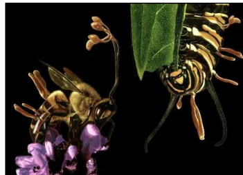
Obra guanyadora de la 4 a edició de Il·lustraciencia de Jaime de la Torre Naharro

S'hi van presentar 550 propostes de més de 40 països. D'aquestes, el jurat en va seleccionar 40 per a l'exposició itinerant. L'il·lustrador espanyol Jaime de la Torre Naharro va ser el guanyador amb l'obra Cordyceps unilateralis .