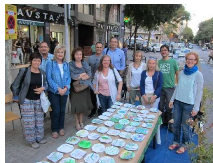
Participants del Parking(Day)

El Park(ing) Day és un esdeveniment anual que, mitjançant la transformació temporal de places d'aparcament, reivindica una ciutat més verda i humana, que aposti per una mobilitat sostenible i per reduir la contaminació atmosfèrica i acústica. Un any més, l'esdeveniment mundial es va organitzar a la ciutat de Barcelona, coordinat per l'Espai Ambiental, amb l'objectiu d'explicar i fer reflexionar a la ciutadania sobre el model de mobilitat, el verd urbà i l'espai públic. L'esdeveniment se celebra des del 2005 i ja hi ha més de 200 ciutats de tot el món que hi participen. L'ACCC hi va participar exposant obres d' Il·lustraciència .