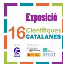
Cartell de la mostra

L'exposició estarà oberta a la Universitat de Vic al Campus de Torre dels Frares (Carrer de la Laura, 13) de l'1 al 25 de febrer, tenint d'horari de visita de 9.00 a 14.00 i de 16.00 a 20.00.