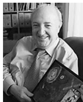
El científic lleidatà, Joan Oró

Seguirà un dinar al qual s'ha convidat els investigadors premiats i finalistes perquè puguin establir contacte entre ells, i amb els membres del Jurat i el conferenciant.