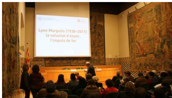
Homenatge a Lynn Margulis