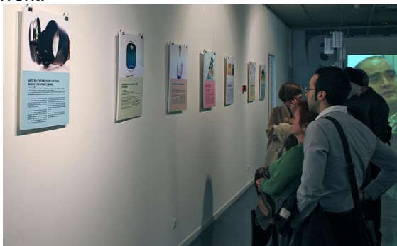
Inauguració de l'exposició (autor: Xavi Joya)

Fins el 14 d'abril totes les reflexions al voltant de la recerca científica són benvingudes. Tothom que es consideri un inexpert en ciència podrà comprovar de primera mà per què val la pena invertir-hi. La creativitat de l'exposició no va ser exclusiva dels científics. «Aquí, els nostres invents» també recull els dibuixos que la canalla i el jovent van crear per a il·lustrar el seu idíl·lic invent.