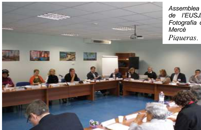
Assemblea de l'EUSJA.

La Unió de Periodistes Científics Italians (UGIS) va organitzar algunes visites a diversos centre de recerca d'aquella ciutat. El centre Internacional d'Enginyeria Genètica i Biotecnologia (ICGEB) combina la recerca amb la cooperació internacional; compta amb 17 grups de recerca i més de 200 investigadors i investigadores de més de 30 països que hi fan recerca en diversos camps de la biomedicina; la seu triestina de l'Institut Nacional de Física Nuclear, on es duu a terme recerca bàsica i aplicada en física subnuclear, nuclear i d'astropartícules, i promou la transferència tecnològica i de coneixement a àmbits com la medicina, els bens culturals i l'ambient. Altres centres visitats van ser l'Institut Italià d'Oceanografia i de Geofísica Experimental (OGS), que té els seus orígens en l'Escola d'Astronomia i Navegació fundada el segle XVIII pels jesuïtes a petició de l'emperadriu Maria Teresa d'Àustria. Actualment, a més dels estudis i recerca geofísics, és un centre destacat en recerca de biologia i biotecnologia marines.