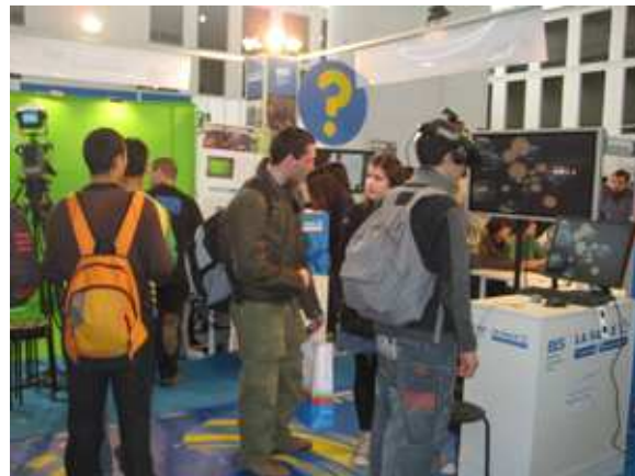
Un dels estands on els alumnes podien comprovar com funciona la realitat virtual.

presentar directament la ciència al jovent i fent-los participants d'experiments i demostracions. En algun moment es té l'agradable sensació d'haver retrocedit en el temps i trobar-se antigues exposicions universals, on cada país mostrava al món els seus avenços tecnològics i la gent hi assistia meravellada per les descobertes científiques. L'espai ha complert amb escriure el seu objectiu d'apropar la ciència als joves i despertar-los la motivació per estudiar alguna carrera científica.