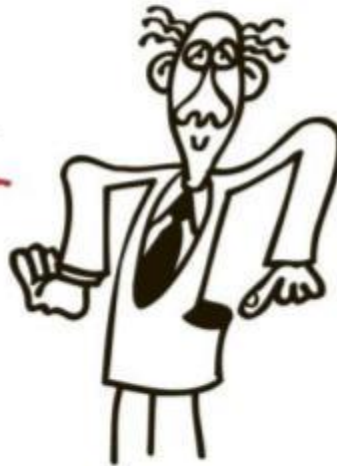
Bolsón de Gürtel