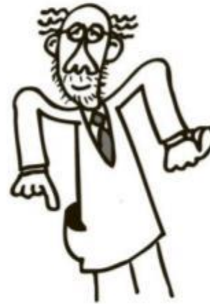
Bolsón de ERE